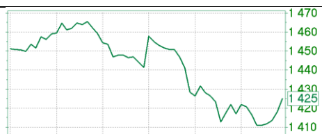
— MICEX [Price]