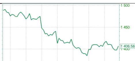
— MICEX [Price]