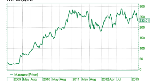
- M.видео [Price]

2009 | May | Aug 2010 | May | Aug 2011 | May | Aug 2012 | Apr | Jul 2013