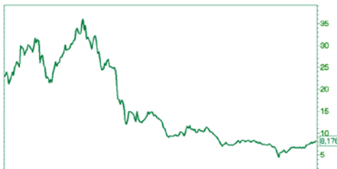
— ММК [Price] 2009 Feb Jun 2011 May Sep 2012 May Sep 2013 May Sep 2014 May Sep 52w Lo — Hi 4.5 — 8.4