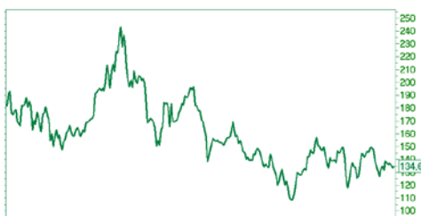
— ГАЗПРОМ ао [Price] 2009 Feb Jun 2011 May Sep 2012 May Sep 2013 May Sep 2014 May Sep 52w Lo — Hi 115 — 157