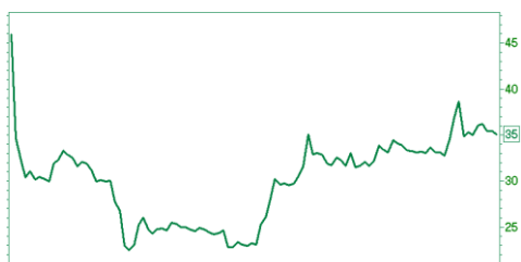
— АЛРОСА ao [Price] 2011|Feb|Apr|Jun|Aug|Oct|2013|Mar|May|Jul|Sep|Nov 52w Lo — Hi 23 — 41