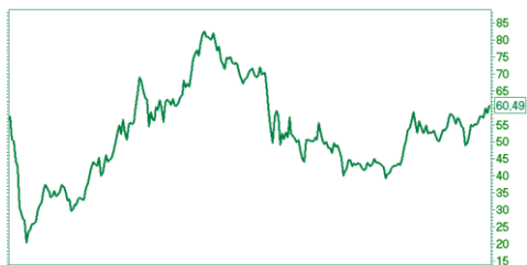
— Аэрофлот [Price] 2008|Mar|Jul|2010|May|Sep|2011|May|Sep|2012|May|Sep|2013|May|Sep 52w Lo — Hi 88 — 111