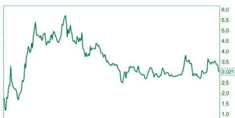
— ММТП ao [Price] 2008|Mar|Jul|2010|May|Sep|2011|May|Sep|2012|May|Sep|2013|May|Sep 52w Lo — Hi 215 — 300